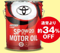
ガソリンエンジンオイル(トヨタ純正品)

※車種によりご使用できない場合がございますので、詳しくはスタッフにお問い合わせください。