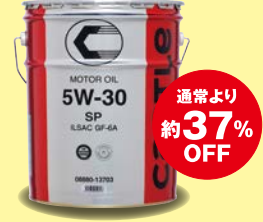
ガソリンエンジンオイル(キャスル)